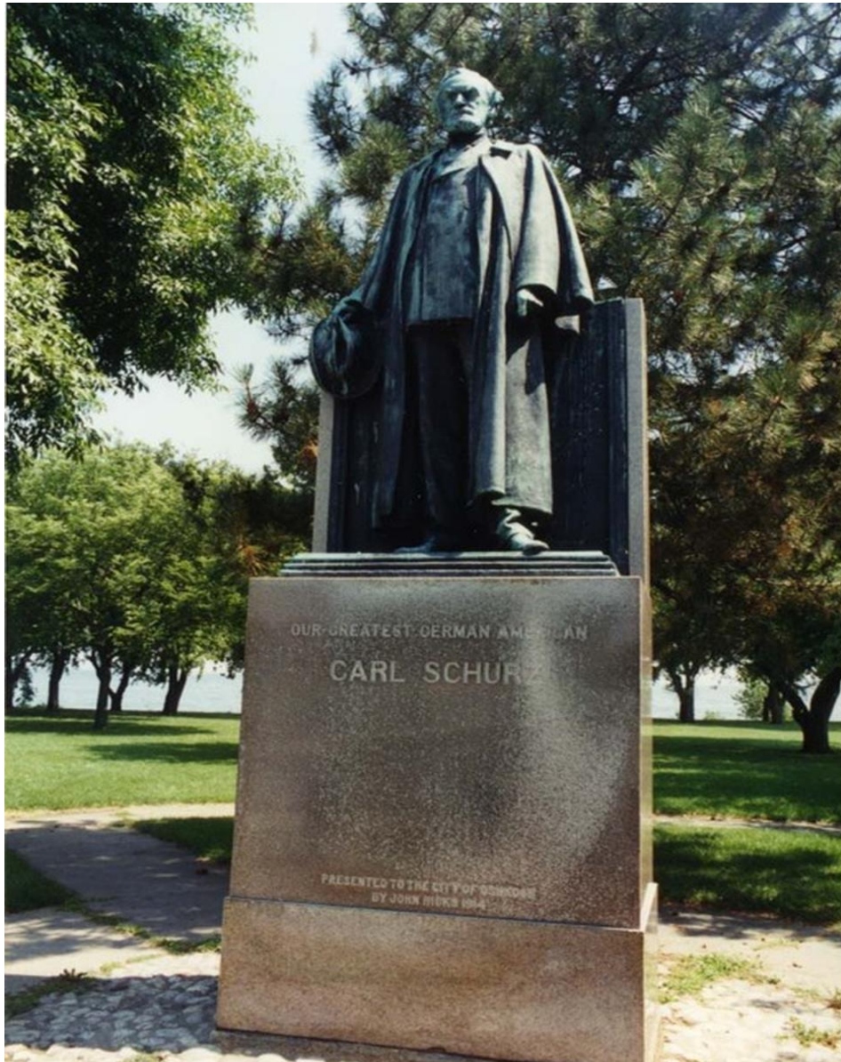
Carl-Schurz-Memorial, Wisconsin Inschrift: „Our Greatest German American“