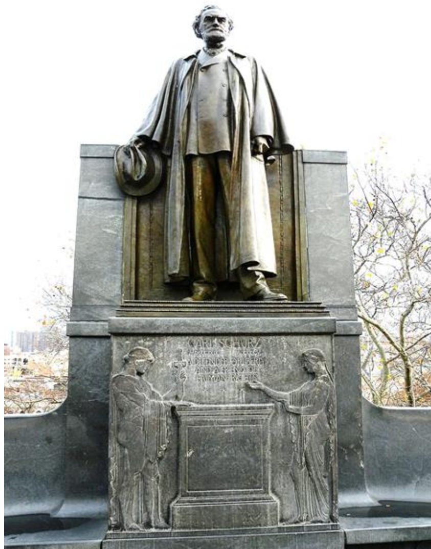
Carl-Schurz-Memorial, New York Inschrift: „Defender Of Liberty And A Friend Of Human Rights“

Notfalls könnte man sich auf die Kopie eines Kopfes dieser beiden Statuen beschränken, wobei Bitter bei dessen Gestaltung die Totenmaske des am 14. Mai 1906 in New York verstorbenen Schurz verwendet haben dürfte, die er ihm selbst abgenommen hatte (so Kessler , a.a.O., m.w.N.).