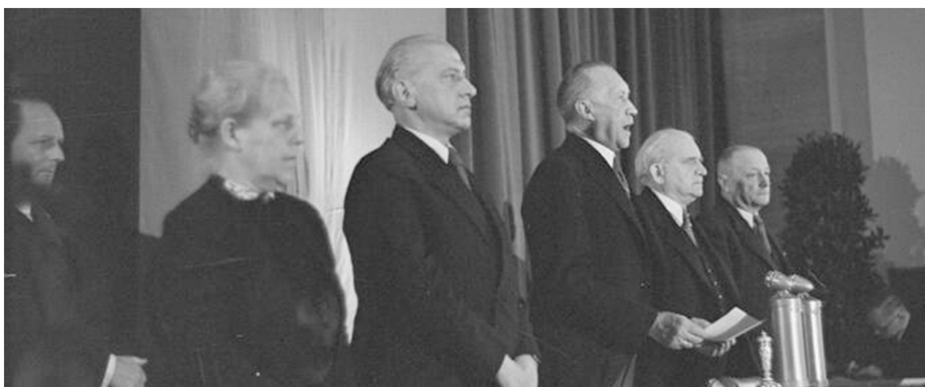
Konrad Adenauer, Präsident des Parlamentarischen Rates verkündet das Grundgesetz für die Bundesrepublik Deutschland in der Pädagogischen Akademie Bonn, links Helene Weber | Weber mit Kanzler B 145 Bild-F090879-0001_layout

1983 wurde die Bildungsstätte des Kreises Paderborn nach der Politikerin benannt. Am Helene-Weber-Berufskolleg werden Bildungsgänge im Ernährungsbereich und in der Sozialpädagogik angeboten.