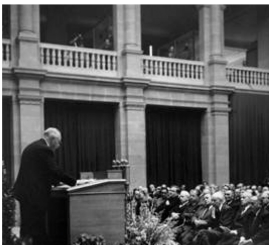
Feierliche Eröffnung des Parlamentarischen Rates am 1. September 1948 im Museum König in Bonn

Bundesrepublik Deutschland hervorging, rund 50 Millionen Einwohner*innen, davon rund 23 Millionen Männer und ca. 27 Millionen Frauen. Im Parlamentarischen Rat diskutierten 61 männliche Ratsmitglieder die zukünftige Staatsordnung. Die Mehrheit der Bevölkerung wurde von nur 4 Frauen vertreten.